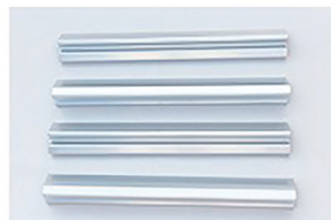
⑤アルミストリンガー（補強棒）